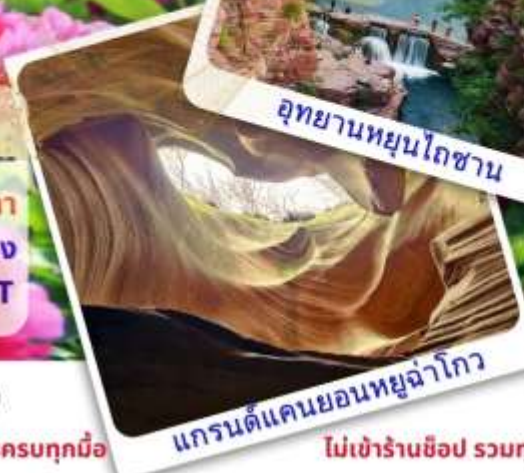
แกรนด์แคนยอนหยูฉ่าโกว