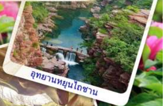
อุทยานหยุนโถซาน