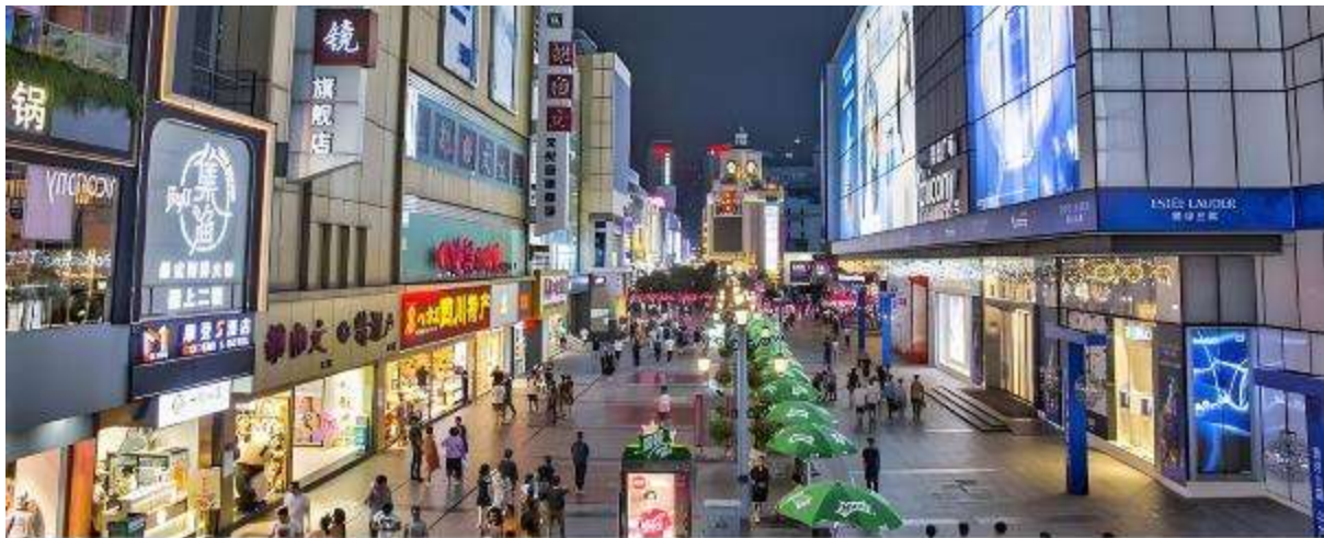
นำท่านสู่แหล่งช้อปปิ้ง ถนนเซินซี เป็นถนนคนเดินที่ใหญ่และทันสมัยที่สุดในเมืองเฉิงตู หรือเป็นย่านวัยรุ่น เต็มไปด้วยร้านค้าและแหล่งช้อปปิ้ง รวมไปถึงร้านอาหารต่างๆมากมาย แหล่งช้อปปิ้ง ร้านช้อปปิ้งหรูหรามากมาย