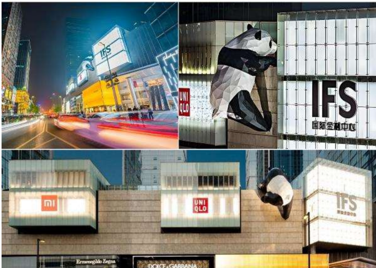
นำท่านสู่เช็ควิน หมีแพนด้ายักษ์ปักกิ่ง (IFS BUILDING) แพนด้ายักษ์สุดแสนน่ารักกำลังปักกิ่ง เป็นประติมากรรมแพนด้ายักษ์แขวนอยู่บนอาคาร IFS ใจกลางเมืองเฉิงตู มีแหล่งช้อปปิ้งมากมาย