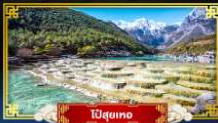
ปี่สุยเทอ