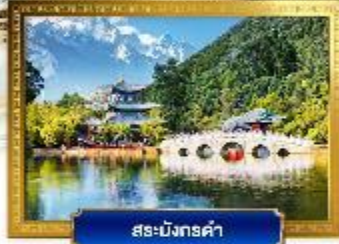
สระมังกรดำ