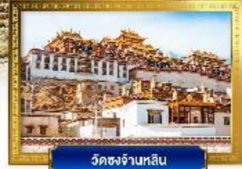
วัดชงจันหลิน