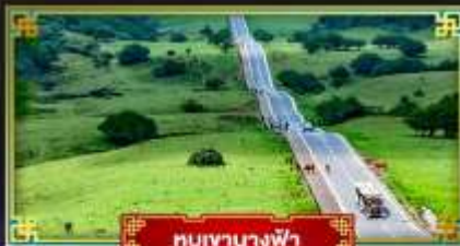
หุบเขานางฟ้า