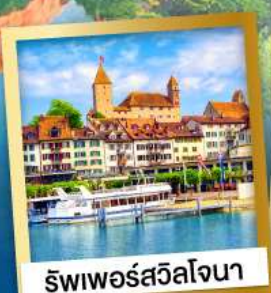
ริพเพอร์สวิลล์