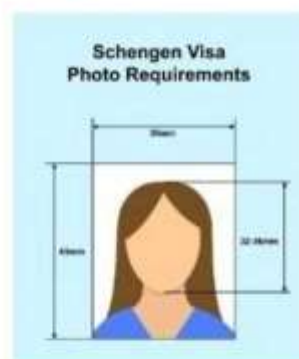
ตัวอย่างรูปถ่าย