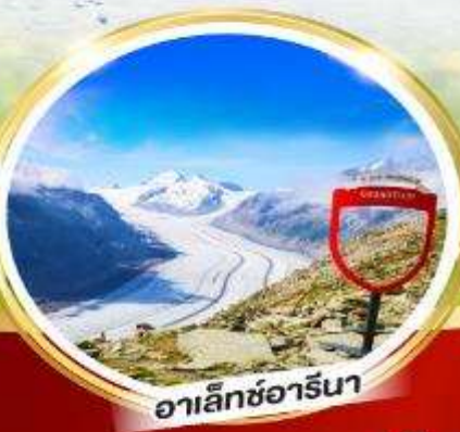
อาเล็กซารีนา