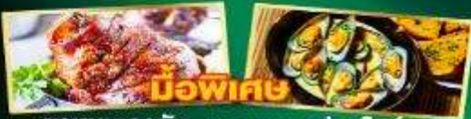
หมูพะพีเศ พาหมูเยอรมัน หอยแมลงภู่อบไวน์ขาว