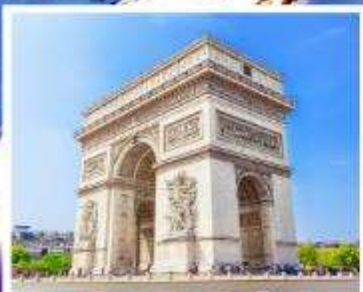
ประตูลีปารีส