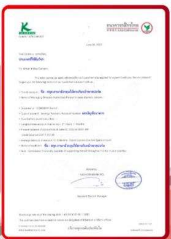
ตัวอย่าง Bank Guarantee ที่ผู้สมัครต้องยื่นขอธนาคาร