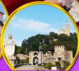
ป้อมชาเรเวทส์