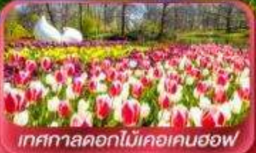
เทศกาลดอกไม้เคอเคนฮอฟ