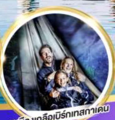
เหมืองเกลือบิรท์เทสกาเดิน