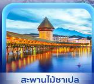
สะพานไมซ์าเปลา