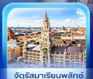
จัตุรัสมาเรียนพลาทซ์

เวียนนา ปราสาทนอยชวาสไตน์ ลูเซิร์น เซอร์แมท ชุก ซูริก