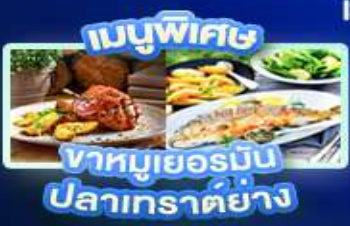
เมนูพิเศษ ชาหมูเยอรมัน ปลาเกราด์ย่าง

เวียนนา ปราสาทนอยชวาสไตน์ ลูเซิร์น เซอร์แมท ชุก ซูริก