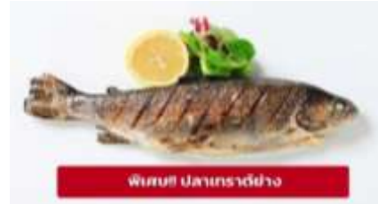
พิเศษ! ปลาเทราต์ย่าง

เย็น ๑๐ รับประทานอาหารเย็น (มื้อที่4) ที่พัก : Gartenhotel Maria Theresia Hall หรือโรงแรมและเมืองระดับใกล้เคียงกัน (ชื่อโรงแรมที่ท่านพัก ทางบริษัทจะทำการแจ้งพร้อมใบนัดหมาย 5-7 วัน ก่อนวันเดินทาง)