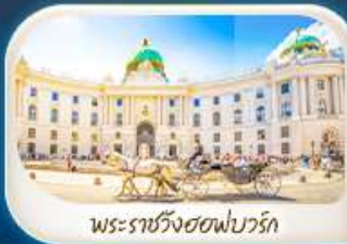
พระราชวังฮอฟบวร์ก

12-18 มี.ค.68 / 19-25 มี.ค.68 28 เม.ย. - 4 พ.ค.68 7-13 พ.ค.68