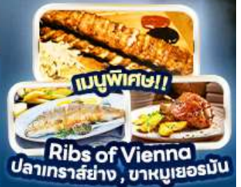
เมนูพิเศษ!! Ribs of Vienna ปลาเทราสย่าง, บาหมูเยอร์มัน