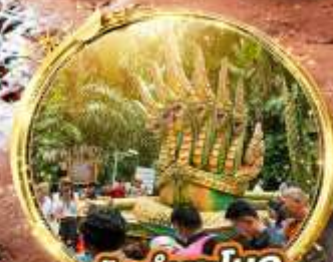
ป่าคำชะโนด