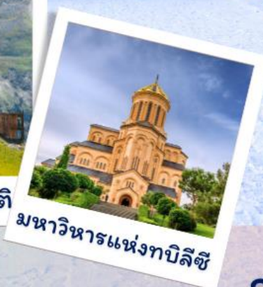
มหาวิหารแห่งทบิลีซี