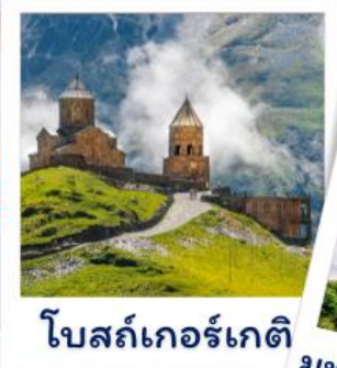
โบสถ์เกอร์เกติ