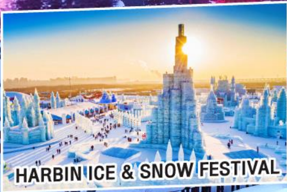
HARBIN ICE & SNOW FESTIVAL