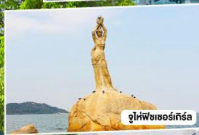
จูไห่ฟิชเชอร์เกิร์ล