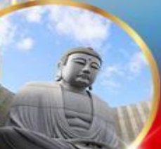
เนินพระพุทธรเจ้า