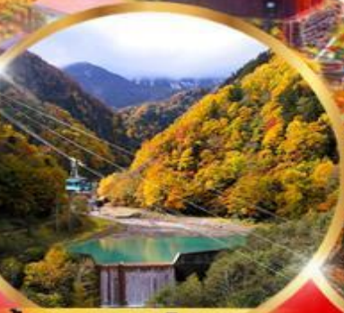
ขึ้นกระเช้าคุโรดากะ