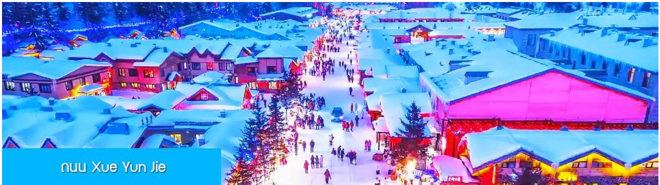
ถนน Xue Yun Jie