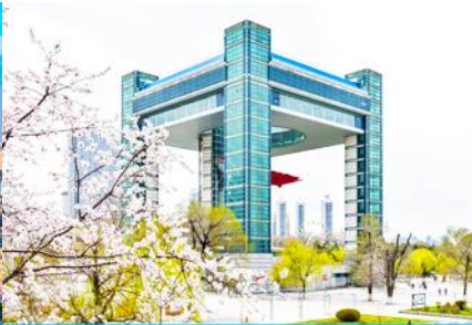
จัตุรัส ซีจี้