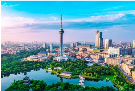
เมืองจี่หลิน

23.30 น. คณะพร้อมกัน ณ ท่าอากาศยานสุวรรณภูมิ อาคารผู้โดยสารระหว่างประเทศขาออกอาคาร ชั้น 4 ประตู 10 เคาน์เตอร์สายการบิน SHENZHEN AIRLINES พบเจ้าหน้าที่บริษัทฯ คอยให้การต้อนรับและอำนวยความสะดวกด้านเอกสารและสัมภาระก่อนการเดินทาง