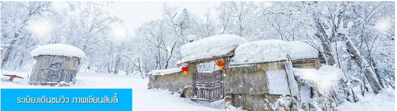
ระเบียบเดินชมวิว ภาพเขียนสิบลิ

ระหว่างทางไกด์ท้องถิ่นจะเสนอขายโปรแกรมเสริมที่ไม่ได้รวมในค่าทัวร์ (ออฟชั่นแนลทัวร์) 2 รายการ