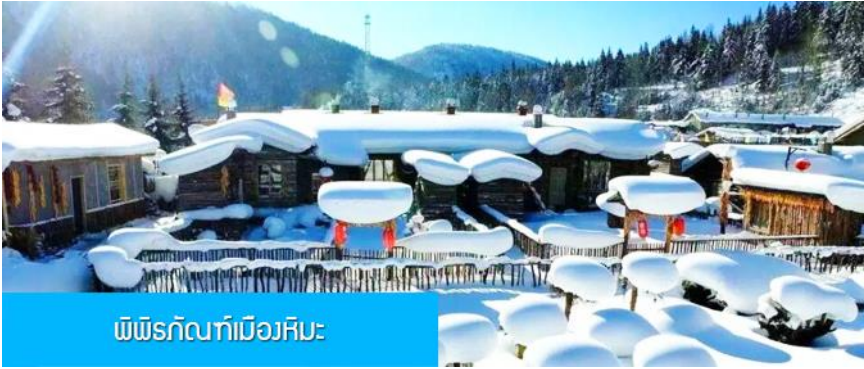
พิพิธภัณฑ์เมืองหิมะ