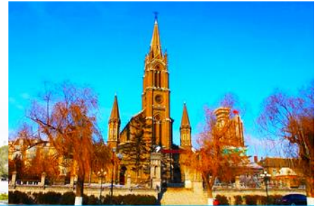
โบสถ์คาทอลิก