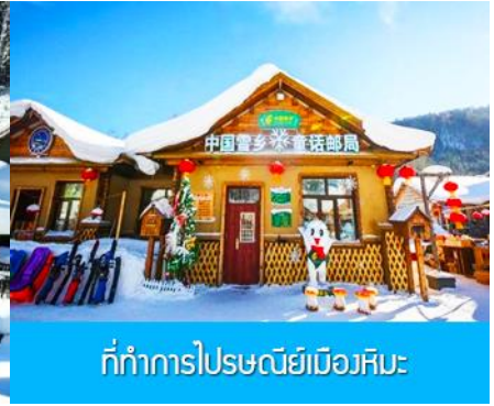
ที่ทำการไปรษณีย์เมืองหิมะ