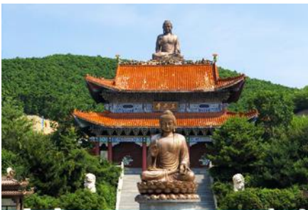
องค์พระพุทธรูปใหญ่จินตึง

พักที่ WAN HAO INTER HOTEL 4* หรือ โรงแรมในระดับเดียวกัน เมืองตุนฮว่า