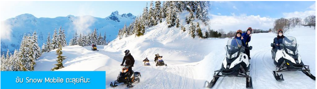
ขับ Snow Mobile ตะลุยหิมะ

รายการที่ 2 นั่ง Snow Mobile ตะลุยหิมะ 雪地摩托车 ท่านสามารถขับ Snow Mobile วิ่งตะลุยหิมะขึ้นสู่ยอดเขา ผ่านเนินเขาที่หนาแน่นด้วยหิมะ ท่ามกลางแนวป่าที่มีต้นไม้ที่มีน้ำแข็งเกาะอยู่ตามกิ่งไม้ เป็นภาพวิวธรรมชาติดูหนาวที่สวยงามน่าประทับใจและพบได้เฉพาะในฤดูหนาวทางภาคอีสานของจีนเท่านั้น เวลาที่ใช้สำหรับโปรแกรมเสริมนี้ประมาณ 1 ชั่วโมงเศษ อัตราค่าบริการ ท่านละ 380 หยวน หรือ 1900 บาท อัตรานี้รวมค่าเช่า Snow Mobile และค่าบริการของไกด์ท้องถิ่น และค่าบริการจัดการของบริษัททัวร์ท้องถิ่น หมายเหตุ โปรแกรมเสริมเป็นโปรแกรมที่ท่านต้องเสียค่าใช้จ่ายเองด้วยความสมัครใจ สำหรับท่านที่ไม่เข้าร่วมกิจกรรมดังกล่าวสามารถนั่งพักในรถได้