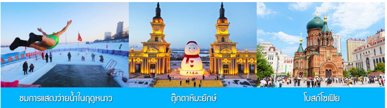
ชมการแสดงว่ายน้ำในฤดูหนาว

ค่ำ รับประทานอาหารค่ำ ณ ภัตตาคาร *เมนูพิเศษ สุกี้ ปิ้งย่าง พักที่ HARBIN SHUIMU CITY SPRING HOTEL 4* หรือโรงแรมในระดับเดียวกันย่านชานเมืองฮาร์บิน