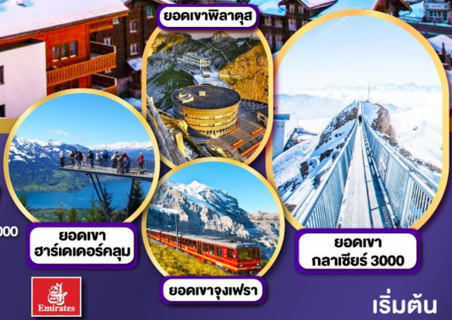
ยอดเขา ฮาร์เตอร์คูลม