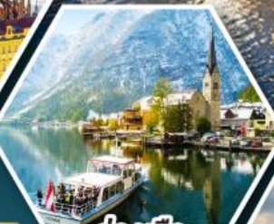
ล่องเรือ ทะเลสาบอัลสติก