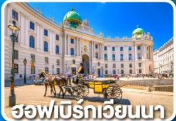
ฮอฟบวร์กเวียนนา