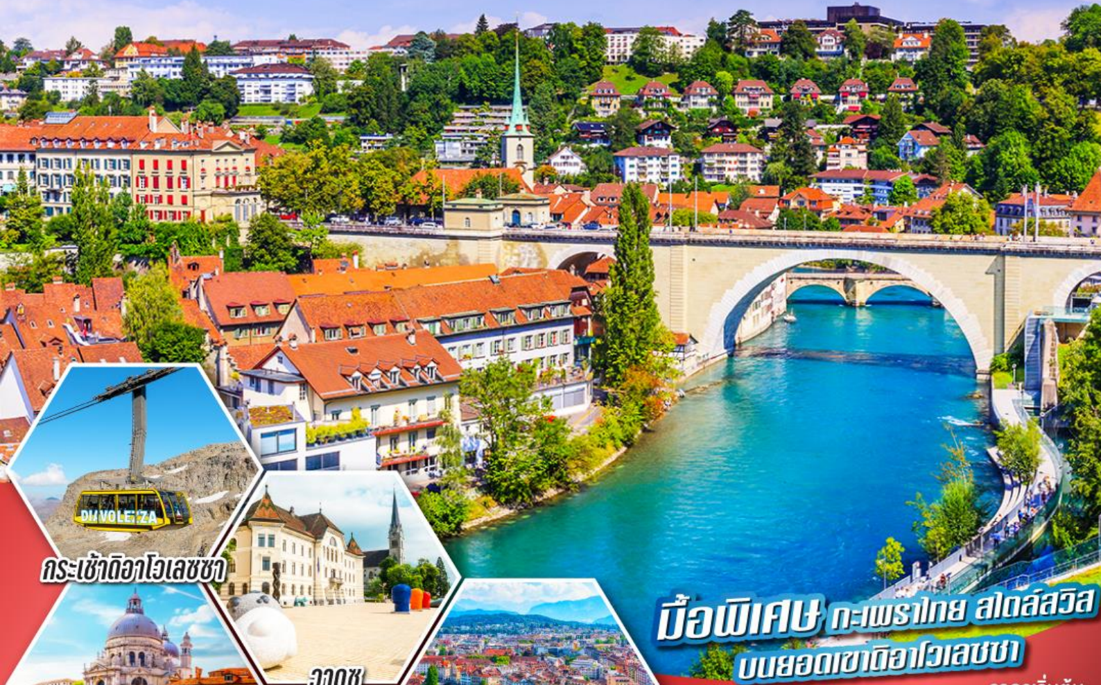
กระเช้าดิวาโอเลซซา