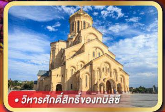
• วิหารศักดิ์สิทธิ์ของทมิลชี