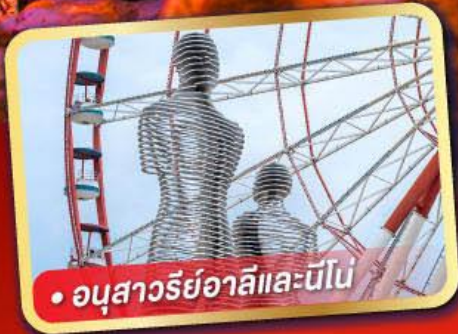
• อนุสาวรีย์อาลีและนีโน