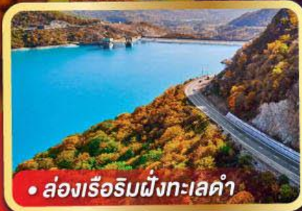
• ล่องเรือริมฝั่งทะเลดำ