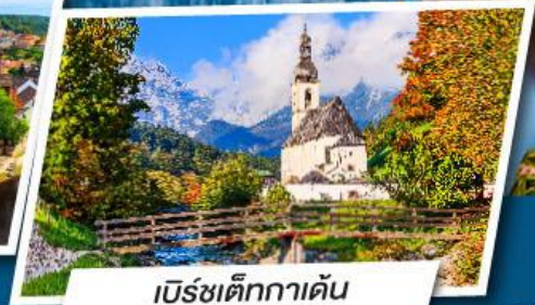
เบิร์ชเต็กกาเดิน