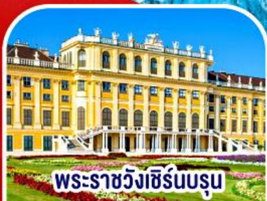
พระราชวังฮีร์นบรูม