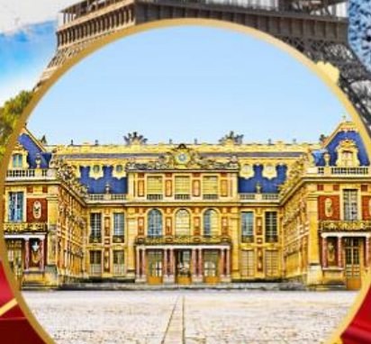
พระราชวังแวร์ซาย