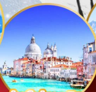
ล่องเรือสู่เกาะเวนิส