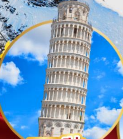
หอเอนปิซ่า