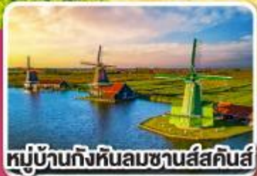
หมู่บ้านกังหันลมซานส์สคินส์