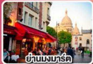
ย่านมงมาร์ต