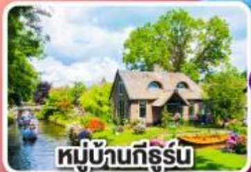
หมู่บ้านกีร์ฮูม

พักปารีสและอัมสเตอร์ดัม อย่างละ 2 คืน ไม่ต้องเปลี่ยนโรงแรมบ่อย