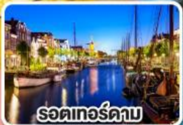
รอดเทอร์ดาบ