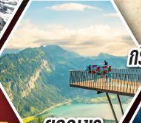
ยอดเขา กรินเดลวาลด์ เพียสตี