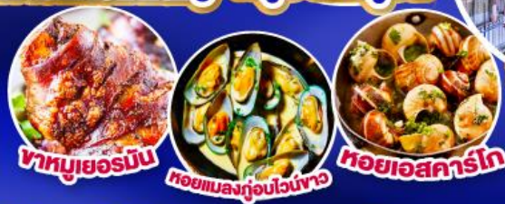
ขาหมูเยอรมัน