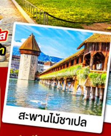
สะพานไม้ซาเปล

เมนูพิเศษ!! หอยแอสคาโก้ ฟองดูชีส พิซซ่าสไตล์อิตาลี สปาเก็ตตี้หมักดำ