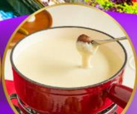
ฟองดูซีส