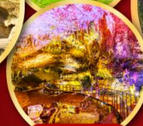
ถ้ำโพรมีธูส

16-23 ก.ย.67 23-30 ก.ย.67 30 ก.ย.-07 ต.ค.67 07-14 ต.ค.67