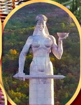
อนุสาวรีย์ มารดาแห่งจอร์เจีย