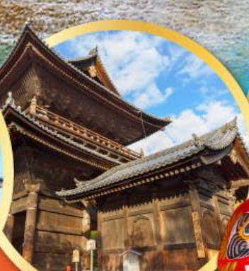
วัดนินเซินจิ