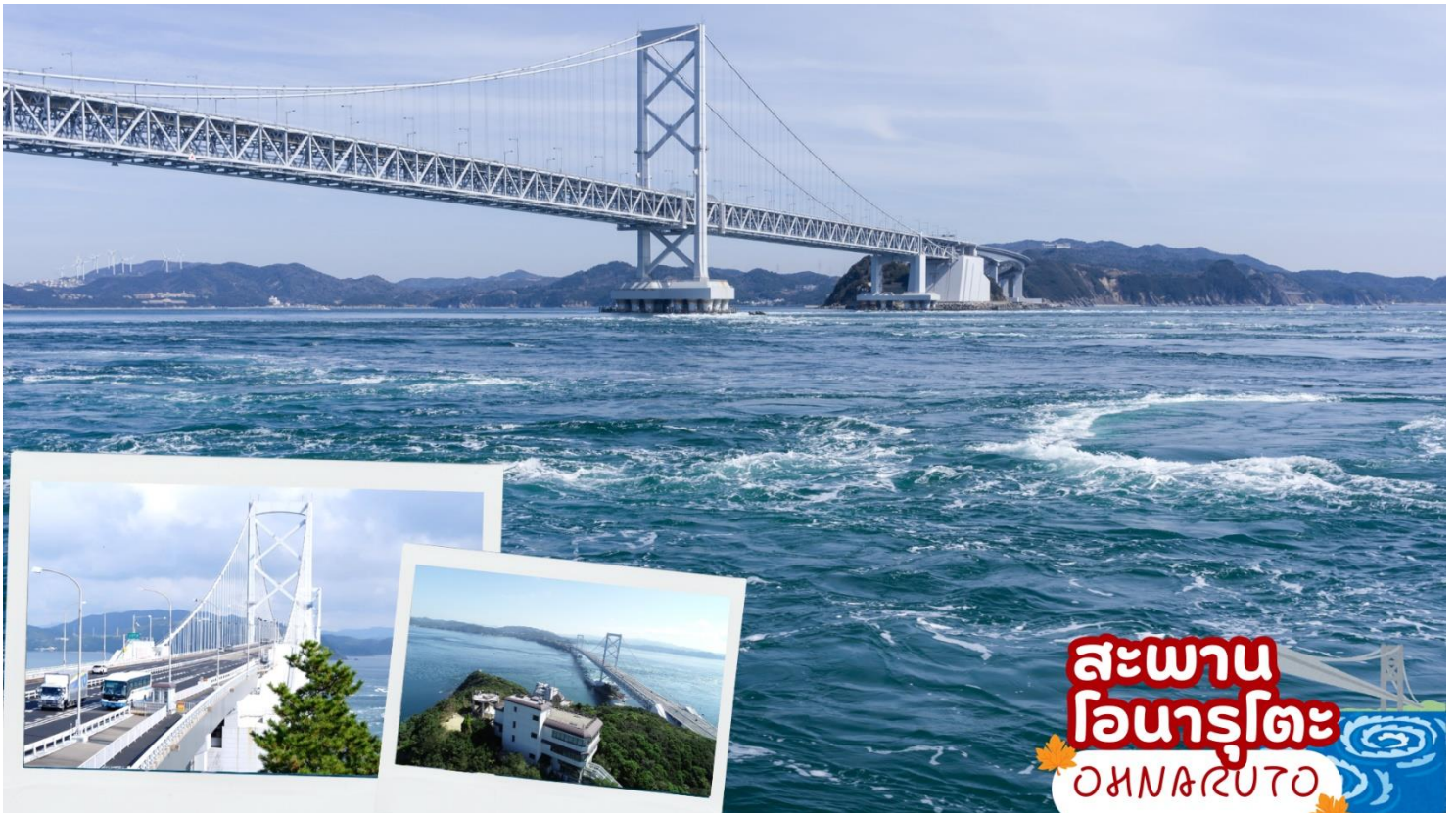
ผ่านชม สะพานโอนารุโตะ ( Ohnaruto ) เป็นอีกแห่งที่เหมาะสมสำหรับการชมน้ำวน จาก “Uzu-no-michi” ทางเดินทอดอยู่กั้นสะพาน นักท่องเที่ยวสามารถมองเห็นวิวเหนือมหาสมุทรแปซิฟิกและทะเลใน