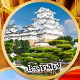
ปราสาทอิเมจิ