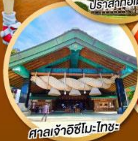
ศาลเจ้าอิชิโมะโทชะ