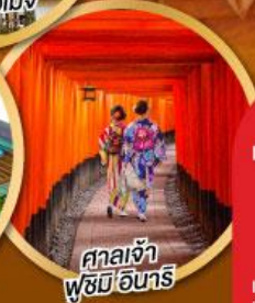
ศาลเจ้าฟุชิมิอินาริ