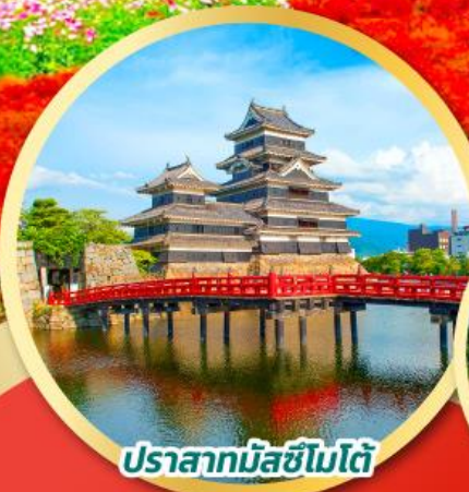
ปราสาทมัตสึโมโตะ