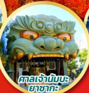
ศาลเจ้านัมบะ ยาชากะ