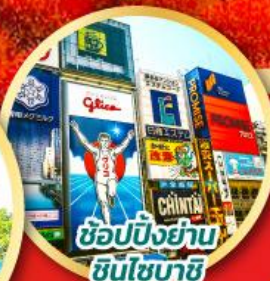
ช้อปปิ้งย่านชินโซบาชิ