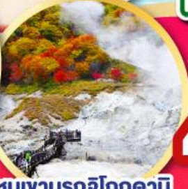
หุบเขานรกจิทอกุดานิ