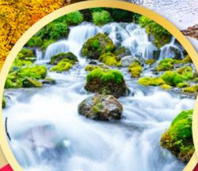
สัมผัสน้ำแร่ธรรมชาติ ณ สวนฟูทิดาชิ