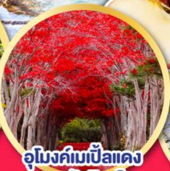
อุโมงค์เมเปิ้ลแดง ณ สวนลับฮิราโอกะ