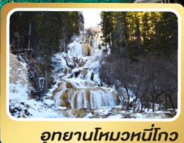
อุทยานโหมวหนี่โกว