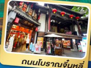
ถนนโบราณจีนหลี่