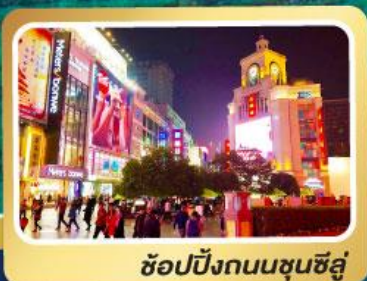
ช้อปปิ้งถนนชุนซีลู่