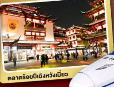
ตลาดร้อยปีเมืองหวงเหมียว