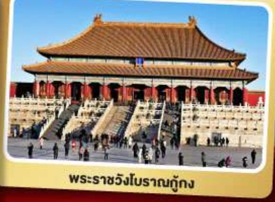
พระราชวังโบราณกู้กง