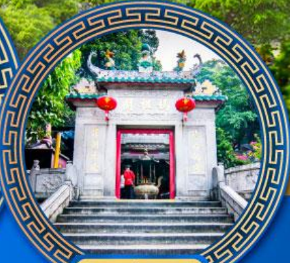
วัดอามา มาเก๊า