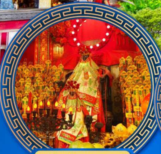
วัดเจ้าแม่กวนอิมสองห้า