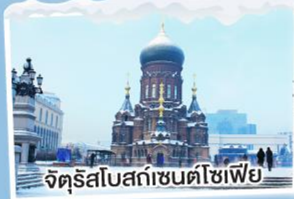
จัตุรัสโบสถ์เซนต์โซเฟีย