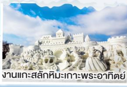
งานแกะสลักหิมะเกาะพระอาทิตย์