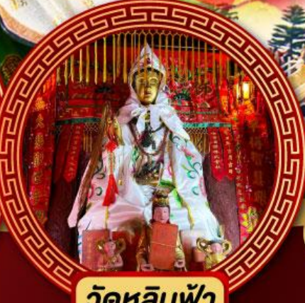
วัดหลินฟ้า