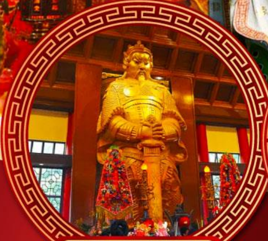
วัดเขกงหมิว