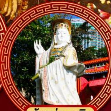
เจ้าแม่กวนอิม รีพัลส์เบย์