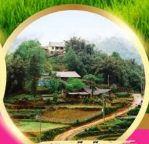
หมู่บ้านกัตกัต