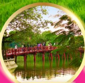
ทะเลสาบคินดาบ