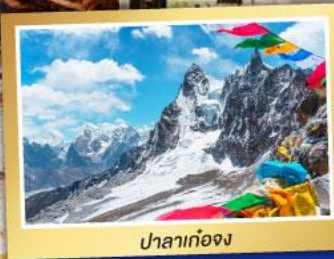
ปาลาก่อจ้ง